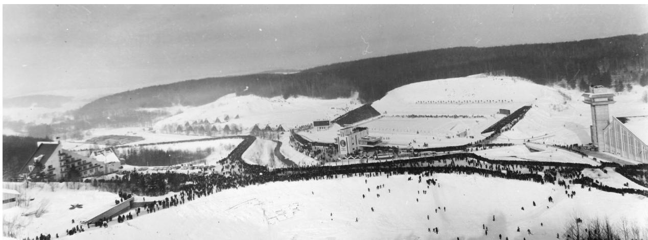
Раубичи, 1974 год, чемпионат мира

спортсменами сборной Советского Союза. Наши студенты составляли конкуренцию на Первенстве Зоны с участием основной команды СССР и порой умудрялись оставлять позади чемпионов мира и Олимпийских игр.