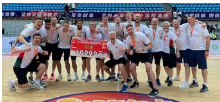
Мужская сборная Беларуси по баскетболу