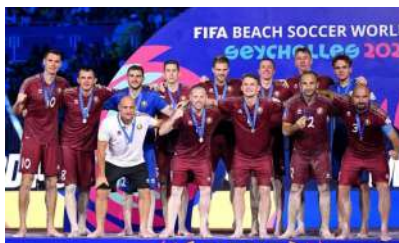
Сборная Беларуси по пляжному футболу

Громкого успеха добилась сборная Беларуси по пляжному футболу на чемпионате мира, который прошел на Сейшельских островах. Наши игроки впервые в истории выиграли медали турнира – серебро. Случай беспрецедентный в целом для нашего спорта: впервые в суверенной истории национальная команда Беларуси по игровому виду спорта стала финалистом мирового первенства. Ранее максимумом были выходы в полуфиналы чемпионата мира по пляжному футболу среди мужчин в 2024 году и чемпионата мира по баскетболу среди женских команд в 2010 году.