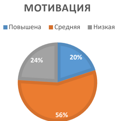
Рисунок 1 – уровень мотивации учащихся 7-х классов на занятиях ФКиЗ

Для выяснения уровня мотивации учеников было проведено анкетирование, в ходе которого было опрошено 85 учащихся 7-х классов. Итоги исследования показали, что у 24 % учеников мотивация повышена, у 56 % – нейтральная и у 20 % – понижена (Рис. 1).