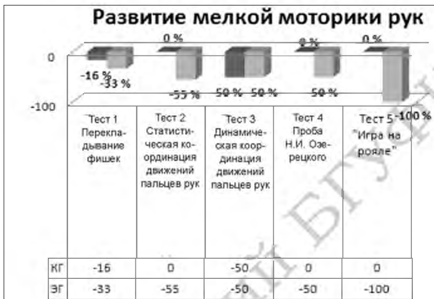
Рисунок 2 – Показатели прироста (%) мелкой моторики рук в КГ и ЭГ после проведения эксперимента

Результаты педагогического эксперимента представлены на рисунке 2.