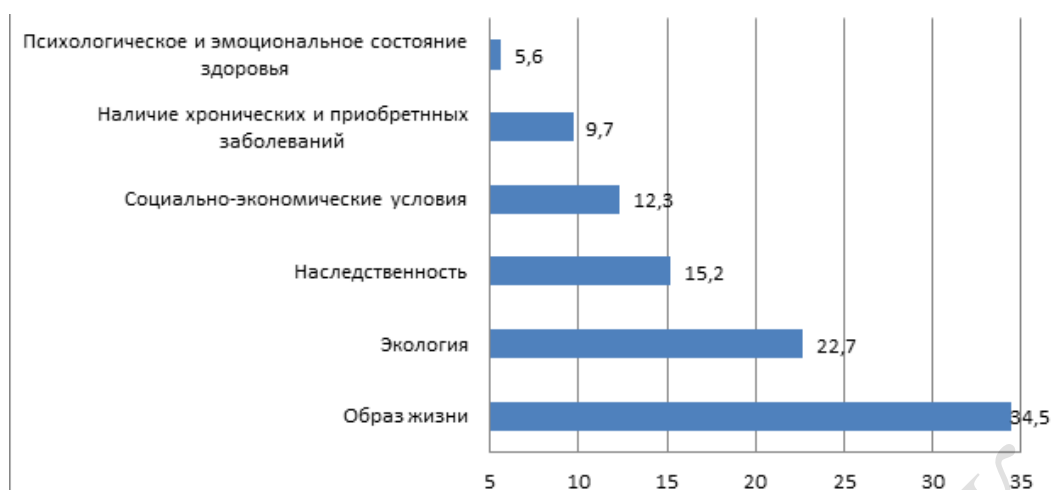
Рисунок 2. – Факторы, влияющие на уровень здоровья студентов

Проводимые исследования показали, что основным критерием, влияющим на уровень здоровья студентов обучающихся в университетах, является образ жизни.