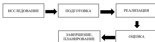
Рисунок 1. – Фазы молодежных инициатив

Во время сопровождения молодежных инициатив важно понимать и учитывать два аспекта – это непосредственная реализация идеи (проектный цикл) и множественность процессов, которые происходят в молодежной команде (групповая динамика). Проектный цикл полностью описывает реализацию самой инициативы. Данные фазы являются достаточно условными и служат для понимания происходящих процессов, а также стоящих перед инициативой задач [6]. Таким образом, каждая инициатива проходит через следующие фазы: исследование, подготовка, реализация, оценка, завершение или планирование следующих инициатив (рисунок 1).