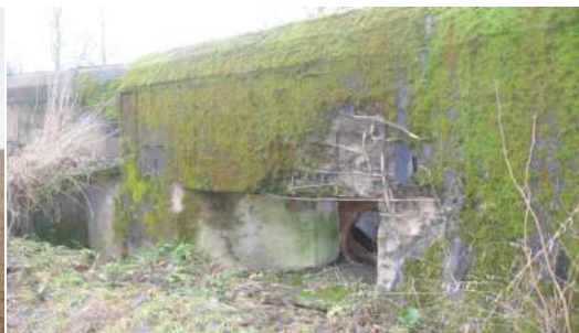
Рисунок 7 – Артиллерийский капонир № 06

Возвращение на ИКК «Линия Сталина» через деревню Путники.