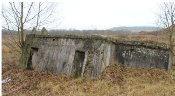
Рисунок 4 – Долговременная огневая точка № 4

Двигаемся в д. Ломшино к пулеметному ДОТу № 5 (рисунок 5) постройки 1932 года. Этот ДОТ принимал участие в боях 1941 г. и был одним из первых, встретивших удар 7-й немецкой танковой дивизии. Имеются следы многочисленных попаданий, внутри прямым попаданием разрушена выгородка коменданта. ДОТ подвергся танковой атаке. Осмотр сооружения.