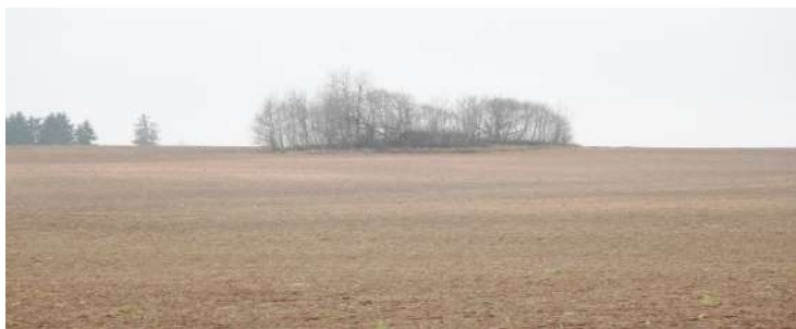
Рисунок 6 – Долговременная огневая точка № 159

1,5 км едем до артиллерийского капонира № 06 (рисунок 7) 1933 года постройки. Эта артиллерийская точка известна тем, что в июне 1941 года три дня удерживала немецкие танки на подступах к Минску. Оснащен капонир был четырьмя 76 мм пушками образца 1902 года (по две с каждой стороны). Гарнизон капонира – 22 человека. Это артиллерийское сооружение – пример наиболее удачного использования оружейных точек во всем Минском укрепрайоне. Осмотр сооружения. Салют памяти в честь павших героев. Организация питания на свежем воздухе (солдатская каша с тушенкой, чай и «фронтовые сто грамм»).