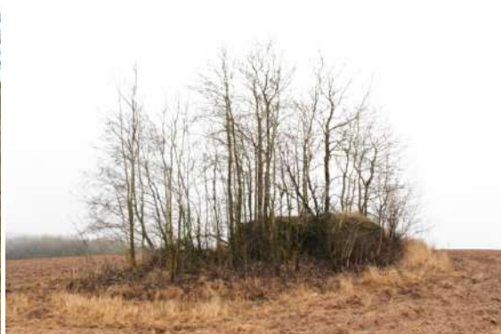
Рисунок 5 – Долговременная огневая точка № 5

Двигаемся пешком по полю к пулеметному ДОТу № 159 (рисунок 6). Трехамбразурный ДОТ класса защиты М-2. Сооружение крайне интересно тем, что принимало участие в событиях обороны Минска в 1941 г. ДОТ, скорее всего, подвергся атаке немецкой штурмовой группы. Огневая точка была атакована фронтально и амбразуры были подавлены с помощью бангалора (так называли взрывчатку, закрепленную на длинном шесте). Сразу бросаются в глаза выгнутые двутавры над одной из амбразур – последствия направленного взрыва. Значительно повреждены амбразурные узлы. Осмотр сооружения.