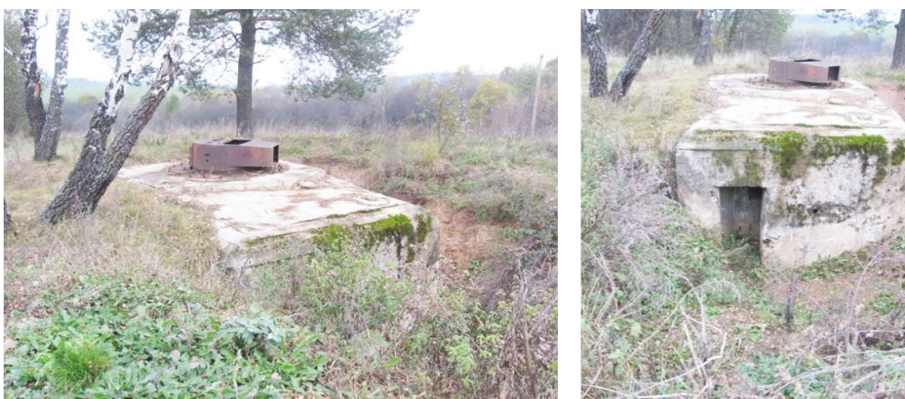
Рисунок 3 – Противотанковая огневая точка № 143

Д. Динаровичи – д. Ломшино. Не доезжая 600 метров до д. Ломшино туристы выходят из машины и 400 метров пешком идут до пулеметного ДОТа № 4 (рисунок 4), который в результате строительной деятельности человека был свален в карьер. Туристам предлагается найти этот ДОТ на месте и установить причины его падения. Участники осматривают сооружение снаружи и внутри в сопровождении экскурсовода.