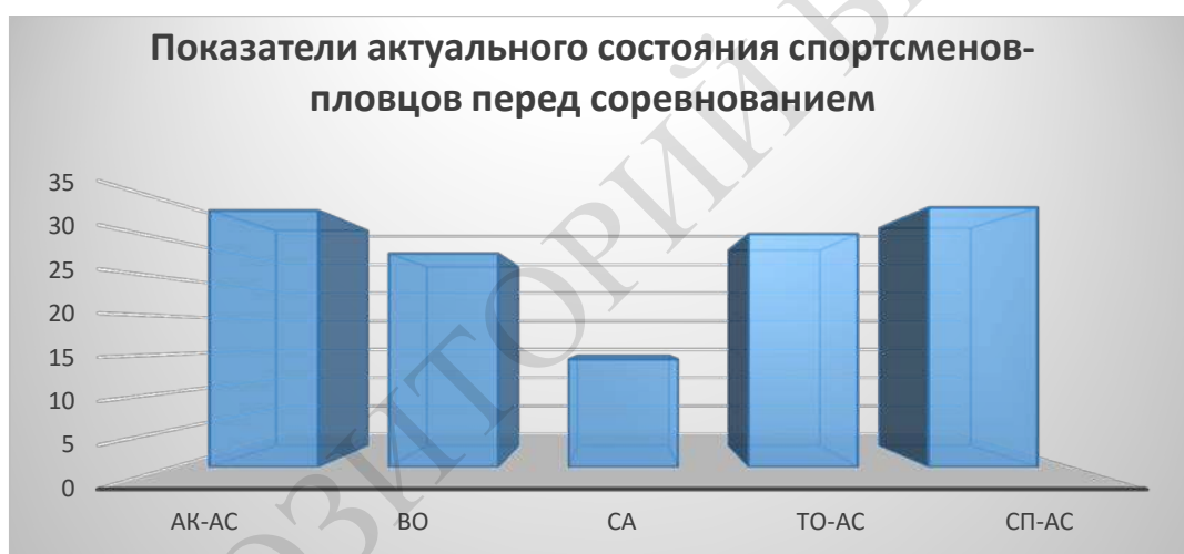
Рисунок 2 – Результаты исследования актуального состояния спортсменов-пловцов

Анализ средних показателей по выборке свидетельствуют о том, что у спортсменов-пловцов предстартовое состояние по некоторым показателям не является оптимальным, так как все показатели актуального состояния находятся в диапазоне пониженных оценок (рисунок 2).