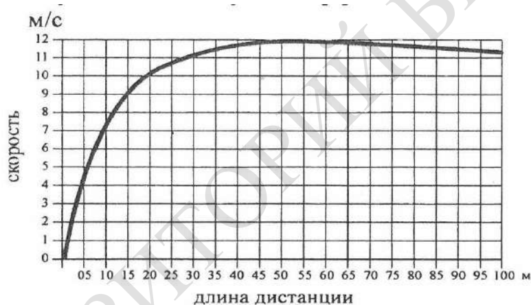
Рисунок 1. – График скорости бега У. Болта на дистанции 100 м при установлении мирового рекорда – 9,58 с

Исходя из фактических данных графика передвижения в беге на 100 м при установлении мирового рекорда с результатом 9,58 с, видно, что на 40-м метре спортсмен (У. Болт) достиг 99% от максимальной; максимальную скорость проявил на 54 м (12,35 м/с) [4, с. 49] и удерживал ее до 60 м бега. После чего до линии финиша отмечается некоторое незначительное постепенное ее снижение (рисунок 1).