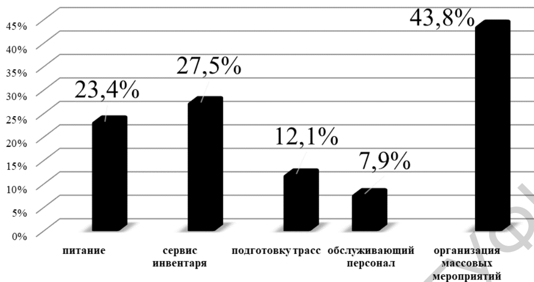
Рисунок 3 – Характеристика развития горнолыжного комплекса «Логойск»

Таким образом, на основе анализа потребителей можно сделать следующие выводы: