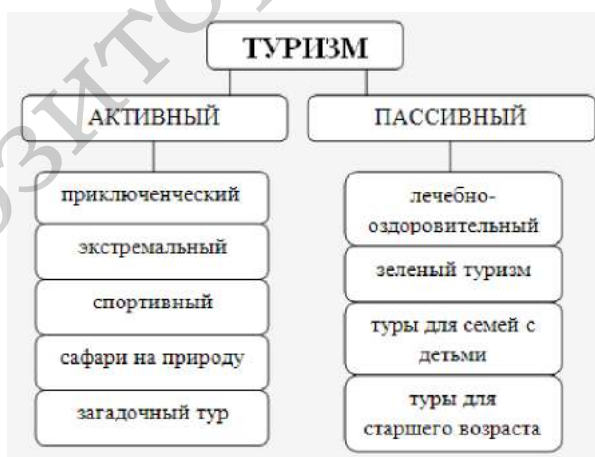
Рисунок 2 – Классификация видов туризма по интенсивности деятельности

Следует считать, что приключенческий туризм относится к активному виду туризма, так как ему присущи высокая степень риска, значительные физические нагрузки, элементы неопределенности, неожиданности в процессе путешествия, что вызывает большой азарт у туристов, но требует от них смелости, выносливости, специфических умений и навыков [2].