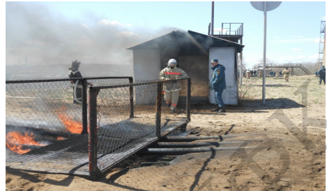
Рисунок 5. – Фрагменты специализированной полосы препятствий для сотрудников МЧС

Следует отметить, что использование различных тренажерных комплексов в виде многоцелевой полосы препятствий для профессионально-прикладной физической подготовки высококвалифицированных сотрудников органов МВД заслуживает особого внимания. Такую полосу можно также использовать как средство контроля и оценки уровня развития координационных и других физических способностей сотрудников правоохранительных органов. Грамотное использование методики обучения технике преодоления полосы препятствий и методики тренировки сотрудников МВД позволят по-новому взглянуть на возможности профессионально-прикладной физической подготовки сотрудников правоохранительных органов.