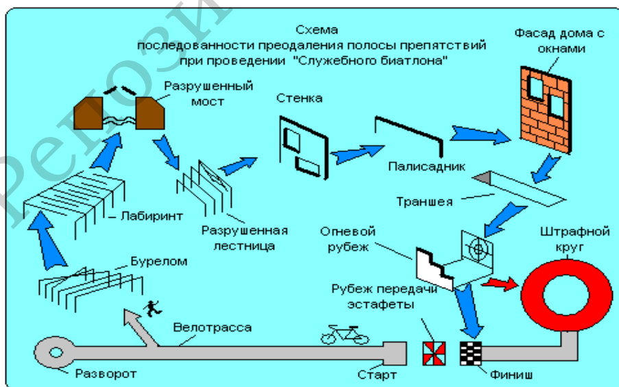
Рисунок 4. – Схема армейского комплекса «Служебный биатлон»