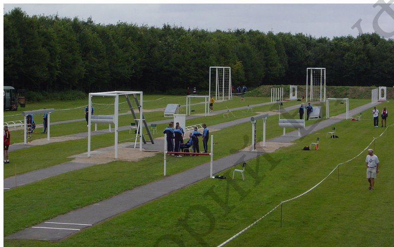
Рисунок 3. – Общий вид армейской полосы препятствий

Армейская полоса препятствий – это полоса местности, оборудованная различными препятствиями и инженерными сооружениями. Она предназначена для тренировки военнослужащих с целью повышения их боевой и физической подготовленности и приобретению навыков преодоления препятствий, встречающихся на поле боя. Полоса, как правило, состоит из таких препятствий, как горизонтальное бревно, изгородь, окоп, чучело для уколов штыком и подставки для удара прикладом, окоп для метания гранат, ров, проволочное ограждение, лабиринт («Змейка»), «разрушенный мост», стенка с двумя проломами, «разрушенная лестница», «подземный лаз (труба-туннель)» и др. (рисунок 3). Разновидностью армейской полосы препятствий является комплекс «Служебный биатлон» (рисунок 4). В том или ином виде полосы препятствий существуют практически во всех армиях мира.