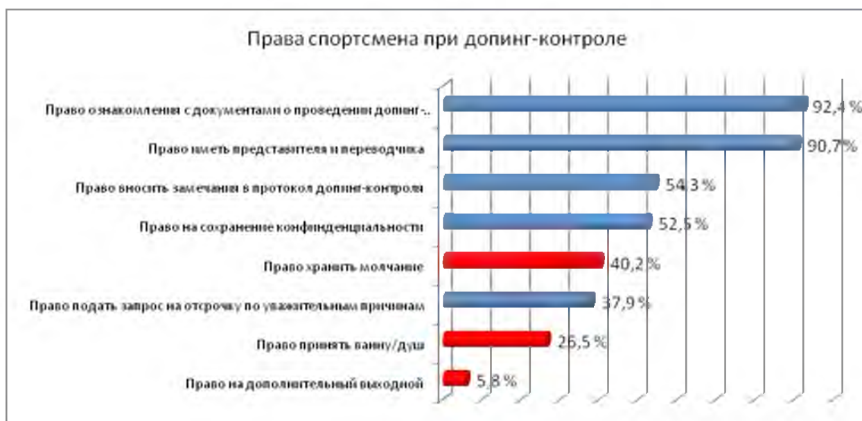
Рисунок 2 – Распределение ответов на вопрос: «Какие права имеет спортсмен с момента получения уведомления о необходимости сдачи допинг-пробы?»

Таким образом, полученные данные социологического опроса тренеров выявили серьезное несоответствие кажущейся осведомленности и реальных знаний тренеров. Участники социологического исследования склонны недооценивать свои знания в области запрещенных веществ, антидопинговых правил и системы допинг-контроля, что, в свою очередь, говорит об антидопинговой некомпетентности многих тренеров. Возможно, чем больше тренеры узнают о всех составляющих антидопинговой программы, тем лучше понимают всю сложность проблемы допинга в спорте. Такие данные подразумевают, что антидопинговые образовательные программы будут более эффективны, если будут обязательны, так как тренеры с наименьшими знаниями считают, что имеют достаточный уровень знаний в данной области.