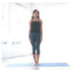
1. Тадасана Поза горы