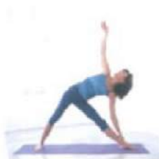
2. Триколасана Поза треугольника