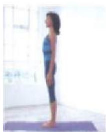
поза горы Тадасана

– сурья намаскар, 1-й вариант, или 2-й вариант (с выпадом).