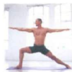
4. Вирабхадрасана-2. Поза Воина-2