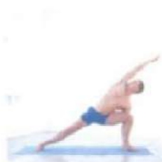
3. Париваколасана. Вытяже- ние в сторону из положения стоя