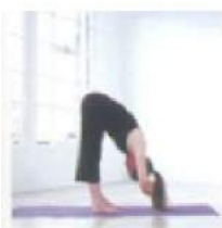
глубокий наклон вперед Уттанасана