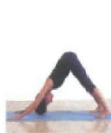
поза собаки мордой вниз Адхо Мукха Шванасана