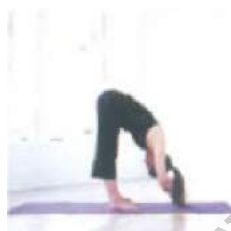
6. Уттанасана глубокий наклон вперед