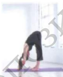
глубокий наклон вперед Уттанасана