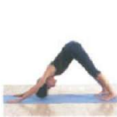
5. Адхо Мукха Шванасана Поза собаки мордой вниз