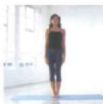
поза горы Тадасана