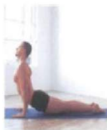
поза собаки мордой вверх Урдва Мукха Шванасана.