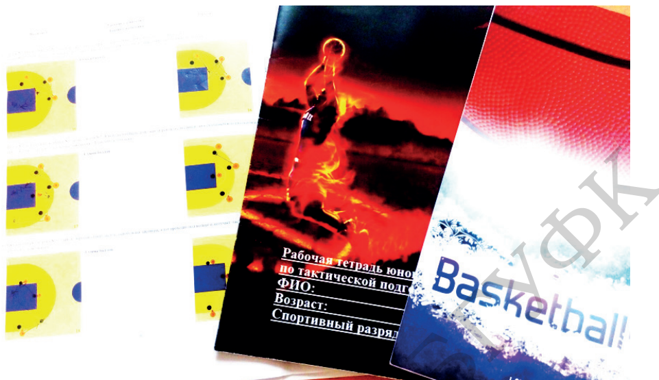
Рисунок 1. – Рабочая тетрадь юного баскетболиста

Второй уровень сложности состоит из заданий для 3–4 человек, а комбинация может состоять из 3–6 действий. При этом решение обычно составляет 2–3 «шага» (хода).