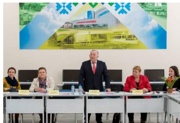
Президиум научно-практической конференции