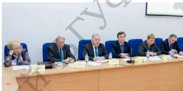
Президиум секции «Оздоровительная физическая культура»

Научно-практическая конференция была представлена двумя секциями: секция 1. Оздоровительная физическая культура (11 апреля) и секция 2. Спортивные игры (12 апреля).