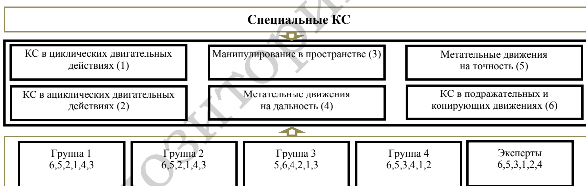
Рисунок 3 – Изменения иерархической структуры специальных КС в длительном процессе профессионального совершенствования сотрудников МОБ

Эксперты к наиболее значимым отнесли способности к копированию и подражанию, метательным движениям на точность, манипулированию предметами в пространстве. Как менее значимые отмечены КС, проявляемые в метательных движениях на дальность, ациклических и циклических двигательных действиях.