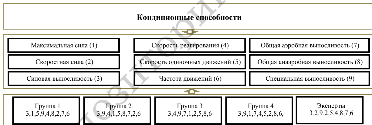
Рисунок 1 – Изменения иерархической структуры кондиционных двигательных способностей в длительном процессе профессионального совершенствования сотрудников МОБ

В результате проведенных исследований выявлено, что в группе ПВК, характеризующих кондиционную подготовленность сотрудников МОБ (рисунок 1), приоритетными являются способности, характеризующие силовую и специальную выносливость. Для начинающих сотрудников высокую значимость также имеют показатели максимальной силы и скорости одиночных движений. В группах со стажем «5–10 лет» и «11–15 лет» силовую и специальную выносливость дополняет способность к быстрому реагированию. В группе сотрудников со стажем «16 лет и более» значимость способности к быстрому реагированию несколько снижается, что объясняется формированием у них специфических компенсаторных возможностей (способности к прогнозированию и т. п.). Респонденты всех групп отметили относительно низкую значимость для сотрудников двигательных способностей, характеризующих способность к высокому темпу движений, общую анаэробную выносливость и скоростную силу. По мнению экспертов, для сотрудников МОБ приоритетными являются двигательные способности, характеризующие силовую выносливость, скоростную силу и специальную выносливость.