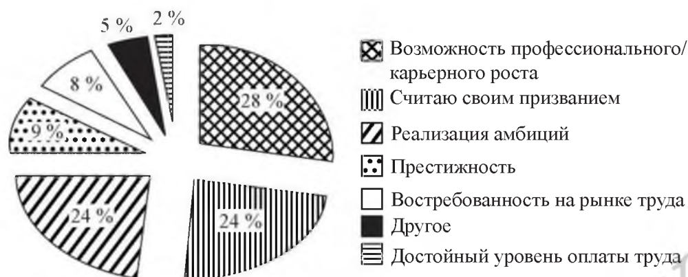
Рисунок 3 – Факторы, определяющие выбор студентов работы в сфере ФКСиТ

оплаты труда (рисунок 3). Следует отметить, что 40 % студентов указали на низкий уровень оплаты труда как на негативный фактор в выборе профессии в сфере ФКСиТ.