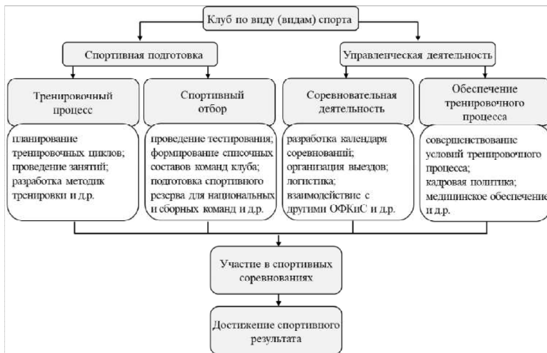
Рисунок 2 – Деконпозиция направлений деятельности спортивного клуба, финансируемых из средства бюджета

Данные рисунка предоставляют возможность определить, что «ядром» деятельности клуба является спортивная подготовка, инструментом по ее эффективному обеспечению служит управленческая деятельность.