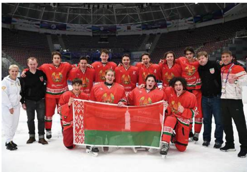
Сборная Беларуси U16

За одиннадцать соревновательных дней представители нашей страны выиграли 247 медалей: 55 золотых, 85 серебряных и 107 бронзовых.