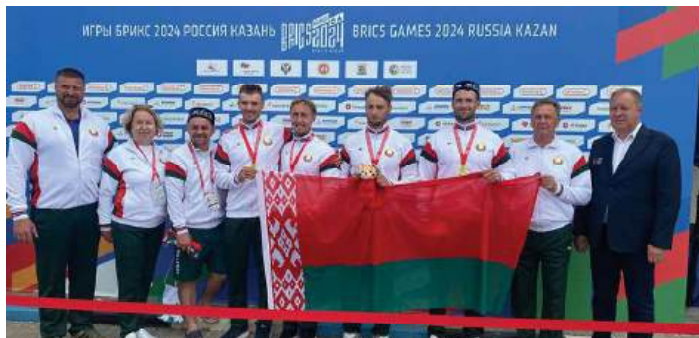
Белорусские байдарочники одержали победы на Играх БРИКС в четверках