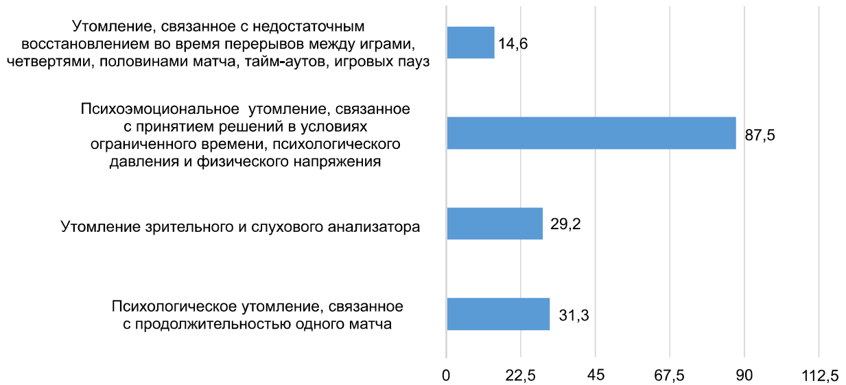
Рисунок 1. – Специфика психологического утомления арбитра при обслуживании матча по баскетболу