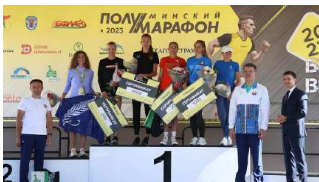
Результаты Международного турнира памяти Заслуженного тренера БССР Е.М. Шукевича