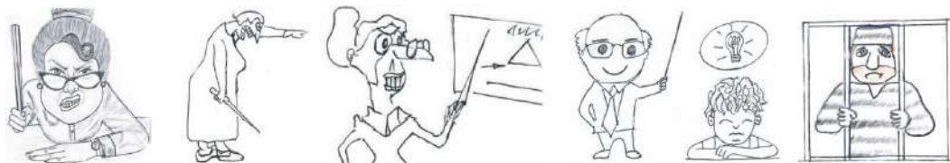
Рисунок 1. – Строгий учитель.

любви, и др. Представленные рисунки с помощью контент-анализа условно были классифицированы на пять кластеров: «строгий учитель»; «дружная семья»; «плачущая девочка»; «ценный подарок»; «вредный одноклассник». Важно было не только представить рисунки, но и объяснить, что каждое изображение означает. В ходе беседы приходило осознание студентами причин проблемы и способа ее разрешения.