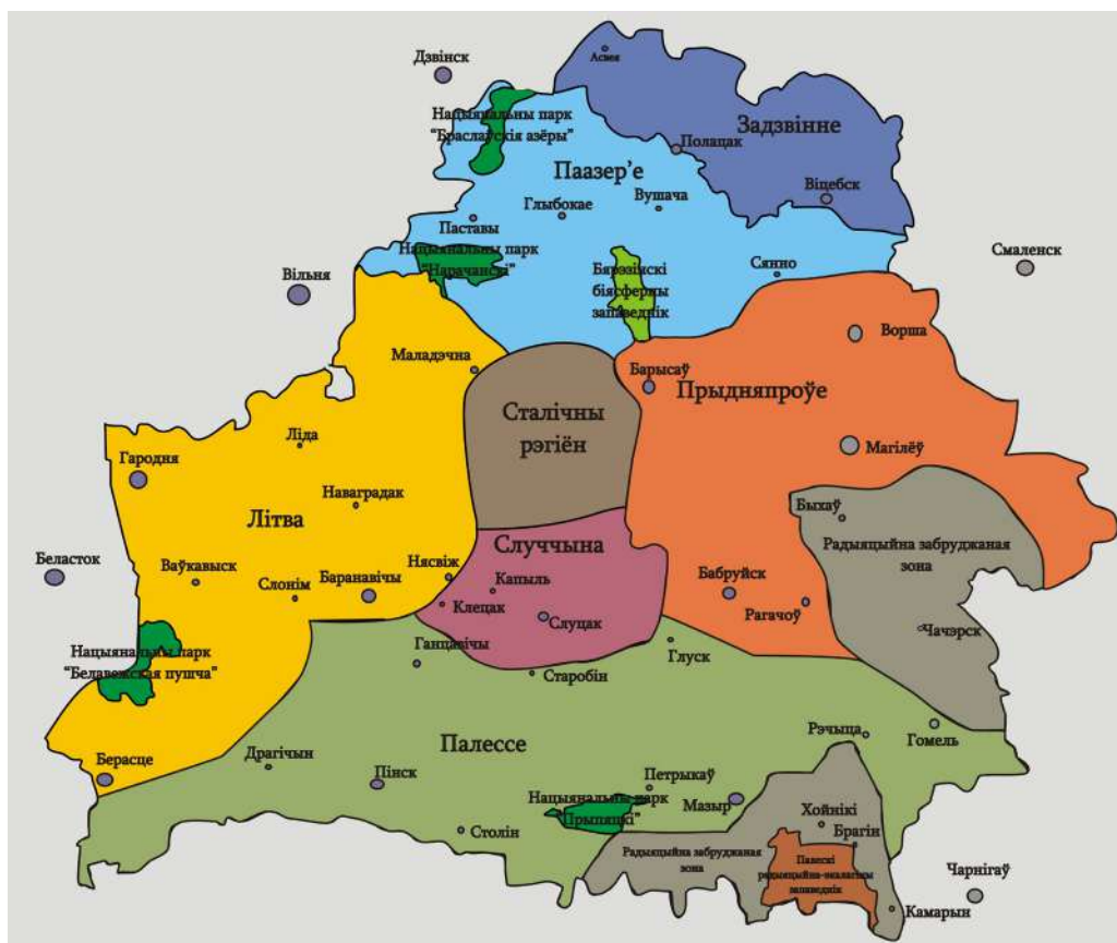
Малюнак 1 – Зоны прыроднага турызму Рэспублікі Беларусь

У выніку праведзенага занавання тэрыторыі Рэспублікі Беларусь паводле вышэйпералічаных крытэрыя было атрымана 6 зон: «Літва», «Паазер'е», «Задзвінне», «Прыдняпроўе», «Случчына» і «Палессе». Сталіца Беларусі і ваколіцы, вылучаныя ў асобны рэгіён, які праз малую наяўнасць прыродных рэсурсаў і высокую тэхнагенную забруджанасць, пры занаванні ў мэтах прыроднага турызму не разглядаліся. Таксама па-за ўвагай пакінуты радыяцыйна забруджаныя тэрыторыі краіны, паколькі ажыццяўленне турызму на іх небяспечна для здароўя не толькі наведвальнікаў, але і абслугоўваючага персаналу. Увасабленне занавання прыведзена на малюнку 1.