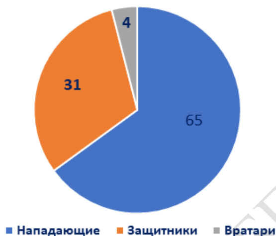
Рисунок 1. – Тренерский состав хоккейных академий России с учетом их игрового амплу

Согласно подсчету в пяти академиях России суммарное количество тренерского состава составило 80 человек (100 %). Далее из этих 80 человек произвели подсчет тренеров амплу «нападающий», их число составило 52 человека (65 %). Затем посчитали количество тренеров амплу «вратарь», их число составило 3 человека (4 %), а также подсчитали количество бывших защитников – 25 человек (31,25 %).