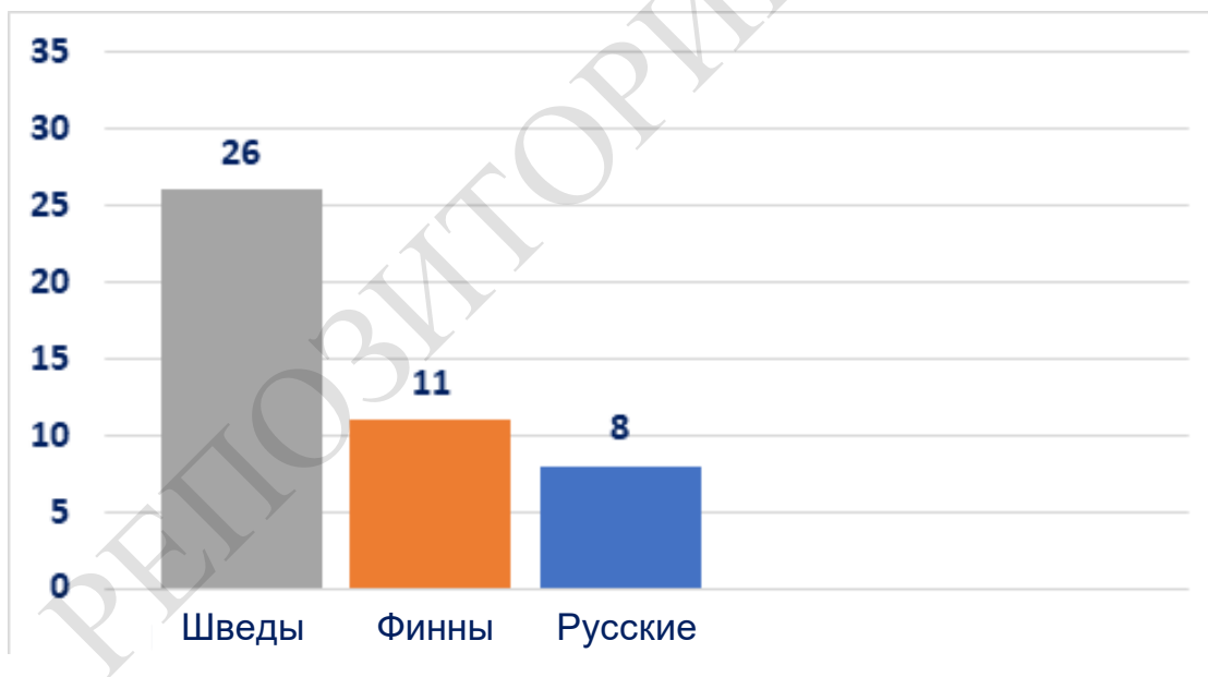
Рисунок 4. – Количество европейских защитников, выступающих в НХЛ

В рамках решения третьей задачи нашего исследования мы провели сравнительный анализ количества европейских защитников в НХЛ в сезоне 2020/2021 трех мировых хоккейных держав (Швеция, Финляндия, Россия). Полученные нами сведения позволили констатировать, что шведских защитников, которые должны выступить в новом сезоне – 26, финских защитников – 11 и российских – 8 (рисунок 4) [8].