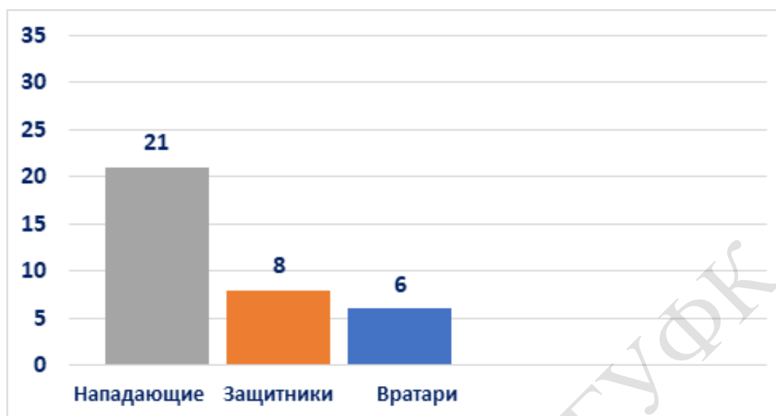
Рисунок 2. – Количество российских игроков, выступающих в НХЛ, с учетом их игрового амплуа

числа) и США (177). На третьем месте в рейтинге оказалась Швеция (79 представителей). Четвертое место – у Финляндии (33), которая обошла Россию (31).