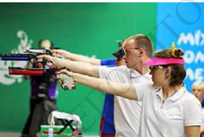
Виталина Бацарашкина и Артем Черноусов (Россия)

Соревнования за 13 комплектов наград по пулевой стрельбе среди 208 спортсменов прошли в обновленном тире имени маршала С.К. Тимошенко.