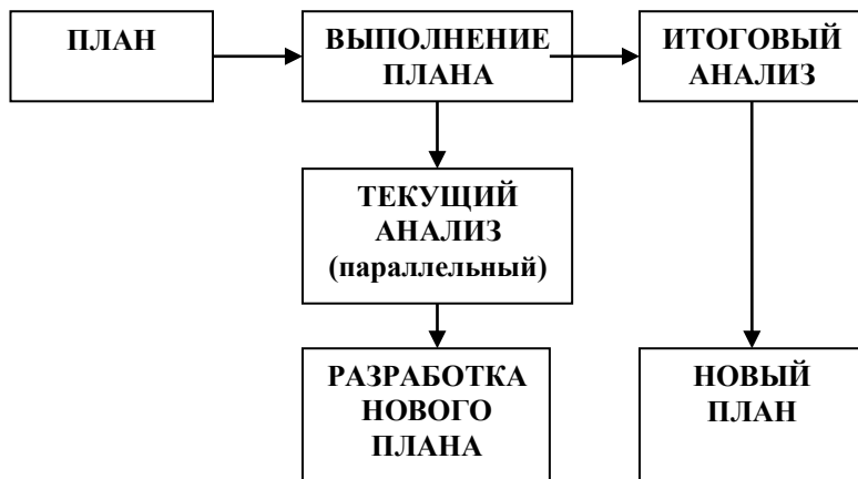
Рисунок 1 – Методика параллельного планирования

Например, анализируя содержание тренировки в предсоревновательном микроцикле и сопоставляя проделанную работу со спортивными результатами, можно выявить положительные стороны, недостатки подготовки и на этой основе внести коррективы в тренировочные планы на последующих этапах. Анализ соревновательной деятельности позволяет определить положительные моменты и недостатки в поведении спортсмена во время соревнований, разработать соответствующие коррективы. Заключительная часть параллельного планирования осуществляется путём подготовки планов тренировочной и соревновательной деятельности к последующим аналогичным соревнованиям или микро- и мезоциклам подготовки (рисунок 1).