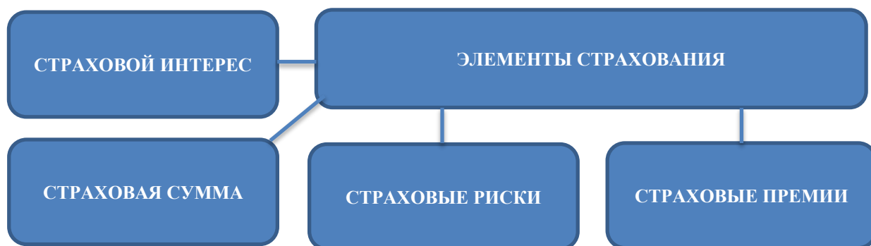
Рис. 5 Элементы страхования